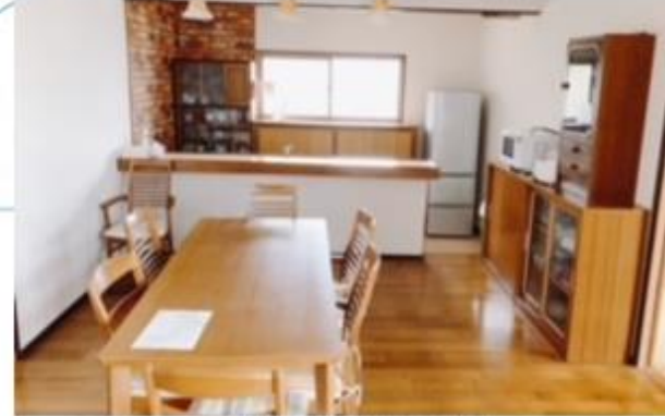
【リビング・ダイニング】