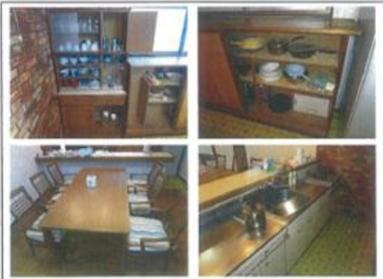
【リビング・キッチン】